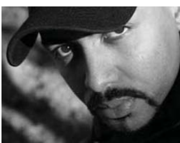
F) EL CHOJIN

1 Nació en una favela en una de las zonas más pobres de Porto Alegre, quedándose huérfano de padre siendo todavía un niño. Su constancia, trabajo y ganas de sacar a su familia de la pobreza, le convirtieron en uno de los mejores jugadores de fútbol del mundo.