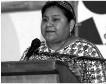
B) RIGOBERTA MENCHÚ