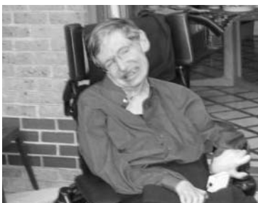
E) STEPHEN HAWKING