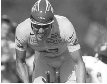
A) LANCE ARMSTRONG

Al igual que Cleveland muchos otros han sido capaces de salir de etapas muy complicadas en su vida. Intenta enlazar los personajes con su historia.