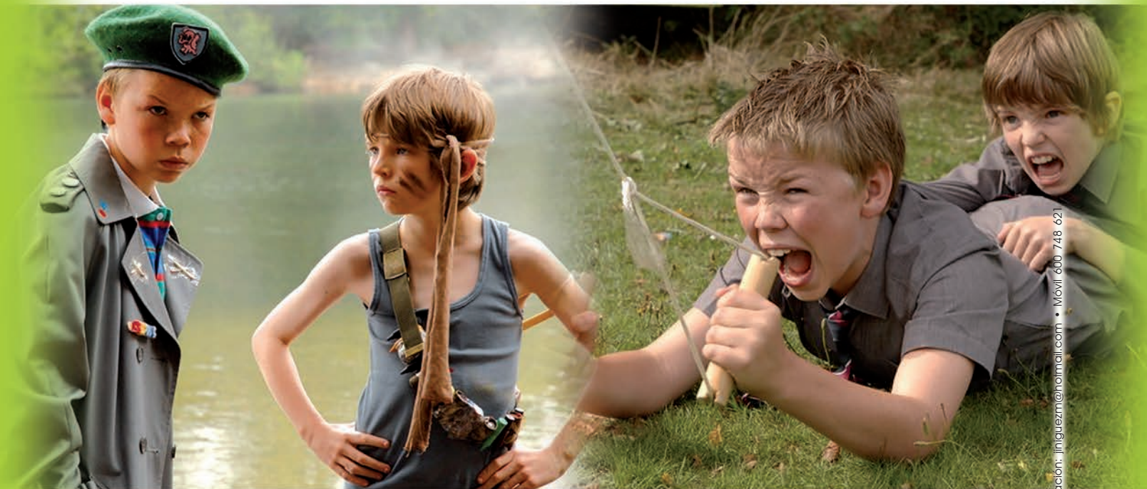
Guías elaboradas por Semana de Cine Espiritual.

¿Sabes qué significa Eucaristía? Procura enterarte.