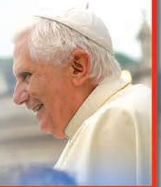
Discurso del papa Benedicto XVI durante el Via Crucis de la JMJ Madrid 2011.

«Queridos jóvenes: que el amor de Cristo por nosotros aumente vuestra alegría y os aliente a estar cerca de los menos favorecidos. Vosotros, que sois muy sensibles a la idea de compartir la vida con los demás, no paséis de largo ante el sufrimiento humano, donde Dios os espera para que entreguéis lo mejor de vosotros mismos: vuestra capacidad de amar y de compadecer».