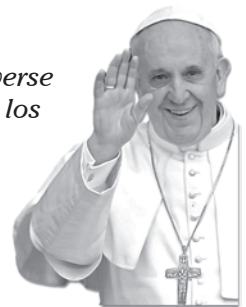
10 consejos para ser feliz del papa Francisco

“ 1. Vive y deja vivir. 2. Darse a los demás. 3. Moverse tranquilamente. 4. Jugar con los chicos. 5. Compartir los domingos con la familia. 6. Ayudar a los jóvenes a conseguir empleo. 7. Cuidar la naturaleza. 8. Olvidarse rápido de lo negativo. 9. Respetar al que piensa distinto. 10. Buscar activamente la paz. ”