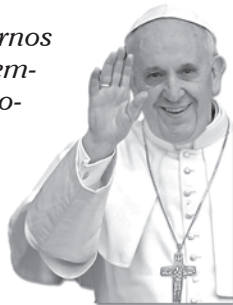
Papa Francisco, Celebración de San Valentín con 20.000 parejas de novios, 14 febrero 2014.

“ Es importante preguntarnos si es posible amarse ‘para siempre’. Hoy en día muchas personas tienen miedo de tomar decisiones definitivas, para toda la vida, porque parece imposible... y esta mentalidad lleva a muchos que se preparan para el matrimonio a decir: ‘Estamos juntos hasta que nos dure el amor’... Pero ¿qué entendemos por ‘amor’? ¿Solo un sentimiento, una condición psicofísica? Ciertamente, si es así, no se puede construir sobre ello nada sólido. Pero, si el amor es una relación, entonces es una realidad que crece y también podemos decir, a modo de ejemplo, que se construye como una casa. Y la casa se edifica en compañía, ino solos! No querréis construirla sobre la arena de los sentimientos que van y vienen, sino sobre la roca del amor verdadero, el amor que viene de Dios. La familia nace de este proyecto de amor que quiere crecer como se construye una casa: que sea lugar de afecto, de ayuda, de esperanza. ”