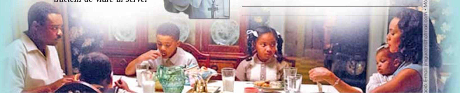
Guies elaborades per Setmana de Cinema Espiritual.

ORGANITZEN: Delegacions de Joventut de Barcelona, Terrassa, Sant Feliu de Llobregat, Vic, Tarragona, Girona, Lleida, Solsona, Urgell, Mallorca i Menorca.