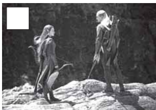
Tauriel i Legolas decideixen ajudar.