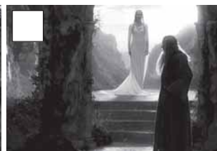
Galadriel recolza Gandalf.

–No es pot lluitar contra les ombres. Una llum sola en la foscor.