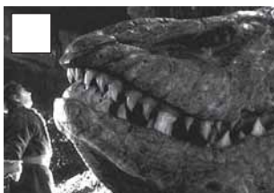
Bilbo desperta el drac.