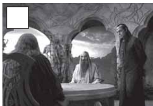
Es reuneix el Concili Blanc.