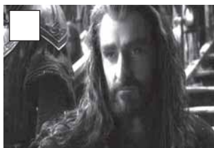
Thorin promet part de l'or als homes.