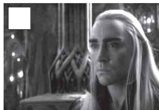
El rei Thraundil rebutja ajudar els nans.