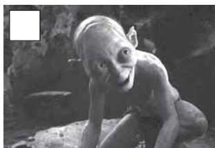
Bilbo coneix Gollum i troba l'anell.