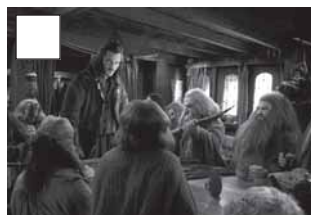
Bardo acull els nans a casa seva.