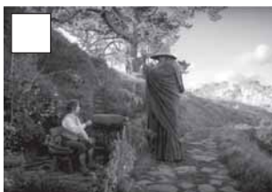
Gandalf invita Bilbo a una aventura.