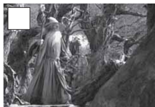
Gandalf es dirigeix a Dol Guldur.

Procura posar ordre en aquest embolic de seqüències de les dues primeres parts de la saga: