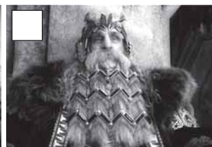
El rei Thor perd el seu regne pel drac.