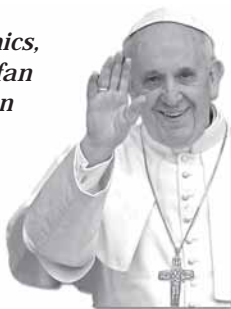
Papa Francesc. Homilia de la Missa matutina, 18 de juny de 2013.

“ Estimar els nostres enemics, els qui ens persegueixen i ens fan sofrir, és difícil; ni tan sols és un «bon negoci». No obstant això, és el camí indicat i recorregut per Jesús per a la nostra salvació. Jesús ens demana estimar els enemics. Com es pot fer? Jesús ens diu: reseu, reseu pels vostres enemics. ”